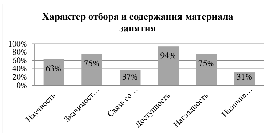
Рис.4 Характер отбора и содержания материала занятия

Проверку знаний осуществляют большинство педагогов, домашнюю работу выдают всего 56% педагогов.