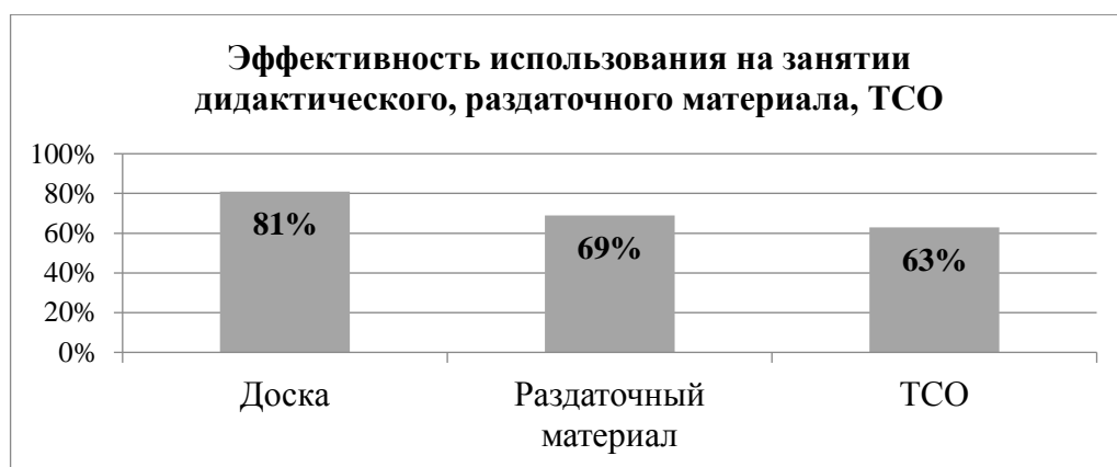
Рис.2 Эффективность использования на занятии дидактического, раздаточного материала, ТСО

Низкий процент использования ТСО на учебном занятии, в том числе связан с особенностями оснащения оборудованием учебных аудиторий.