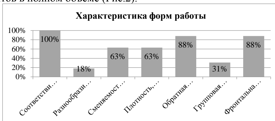
Рис.3 Характеристика форм работы

Формы работы педагогов зачастую соответствуют целям и содержанию занятий. Разнообразие структуры занятия редко применяется педагогами, но больше половины педагогов организуют сменяемость форм работы студентов во время учебного занятия. Большая часть педагогов получают обратную связь от студентов в полном объеме (Рис.2).