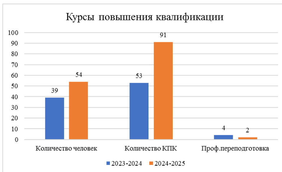
Рис. 2 Сравнение пройденных курсов повышения квалификации

реализации ФГОС нового поколения» и «Особенности преподавания уголовно-правовых дисциплин»